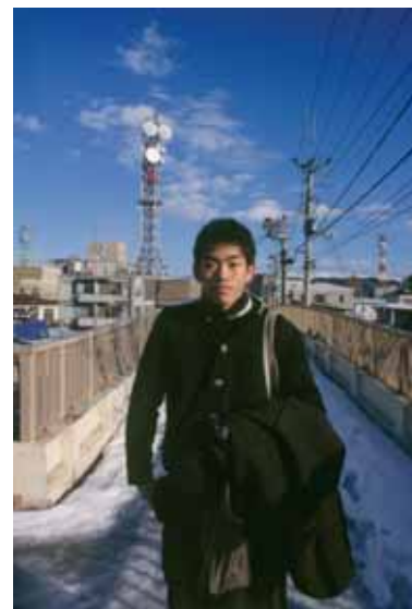
27 | Αίθουσα Τέχνης Αέναον Ελένη Μαλιγκούρα Japan Projects - Readings II

Το νομό της Fukushima της Ιαπωνίας φωτογράφησε η Ελένη Μαλιγκούρα στο πλαίσιο του ιαπωνικού φωτογραφικού προγράμματος European Eyes On Japan/Japan Today vol.8 και στις εικόνες της αποτύπωσε τόσο τα φυσικά και αστικά τοπία όσο και τους καθημερινούς ανθρώπους, αυτούς δηλαδή που σκιαγραφούν ευκρινώς το προφίλ της σημερινής Ιαπωνίας.