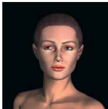
25 | Τεχνόπολις Δήμου Αθηναίων 25

Γρηγορίου Αυγεντίου 1 & Κασσαβέτη 18, Κηφισιά, Τηλ.: 210 8019975, Τρ - Παρ 11:00-19:00, Σαβ - Κυρ 11:00-21:00