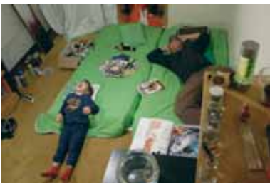
21 | Aleph Γιάννης Κωσταρής Ιδιωτικοί Χώροι I & II

Άνθρωποι, από δεκαοκτώ έως τριάντα πέντε ετών ποζάρουν μπροστά στο φακό του Γιάννη Κωσταρής, για πρώτη φορά στη ζωή τους και εκτίθενται τόσο οι ίδιοι όσο και το πολύ προσωπικό τους περιβάλλον. «Ιδιωτικοί χώροι» και πρόσωπα βαλμένα στο κάδρο με σεβασμό και φροντίδα από το φωτογράφο αποκαλύπτουν την ταυτότητά τους.