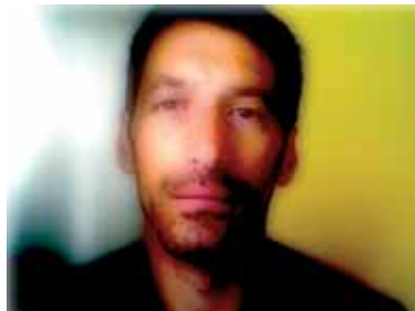
22 | Diana Gallery - Down Town Photo Booth: Self Portraits Self-portraits of 30 Photographers Plus...

Αυτοπορτραίτα, σύγχρονης ψηφιακής τεχνολογίας, καλλιτεχνών και άλλων συμμετεχόντων στο «13ο Διεθνή Μήνα Φωτογραφίας», εκθέτουν και ταυτολογούν, καλύπτουν και αποκαλύπτουν πρόσωπα γνωστά και άγνωστα. Φωτογράφοι και όχι μόνο, αφήνουν στα βλέμματα των θεατών τη σύνθεση της εαυτώ εικόνας τους.