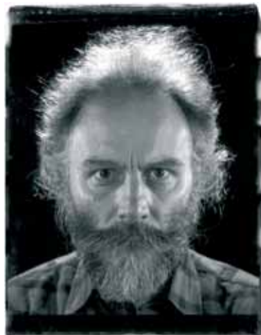
23 | Xippas Gallery Chuck Close (USA)

Πλατεία Καρύτση 5, Τηλ: 210 3249626, Δευ, Τερ, Σαβ 11:00-16:00, Τρ, Πεν, Παρ 11:00-19:00