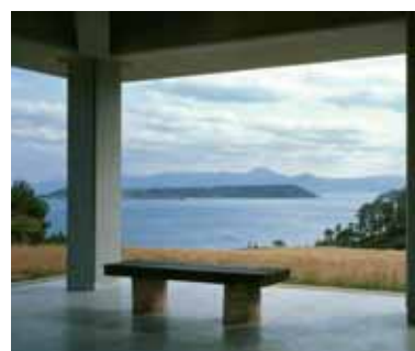
28 | a.antonopoulou.art Karin Borghouts (Belgium) Saga 2005

Κατεχάκη 70, Τηλ.: 210 6785086, Καθημερινά (εκτός από Κυριακή πρωί) 10:00-14:00 & 18:00-21:30